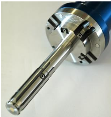
Messen von 3 Durchmessern und 1 Tiefe in einem Schritt. Sitz und Ventilfehrung