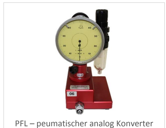
PFL – pneumatischer analog Konverter