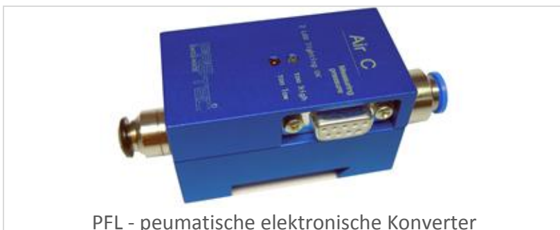
PFL - pneumatische elektronische Konverter

Der neue PFL - pneumatische elektronische Konverter ist das kompakteste und innovativste Produkt in dieser Kategorie. Er ist einfach zu installieren und einzusetzen mit günstigen Kostenverhältnis. Seine technischen Leistungen entsprechen den hohen Anforderungen an die hohe präzise Messtechnik.