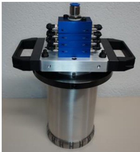
Durchmessern 140H6, 2x8 Luftmessdüsen für Rundheit für LKW Motorblock V8.