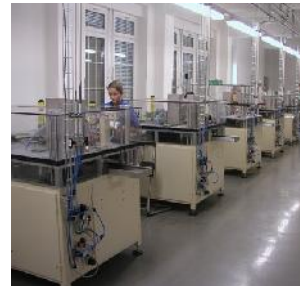
Proiecte la cheie