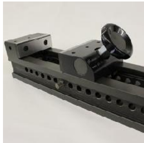
Mehchine de precizie