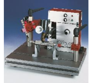
Bancuri de testare