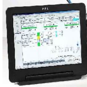
Display si software